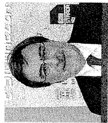
Il mare diventerà finalmente accessibile, nella via più breve e veloce. Un problema che durava da anni