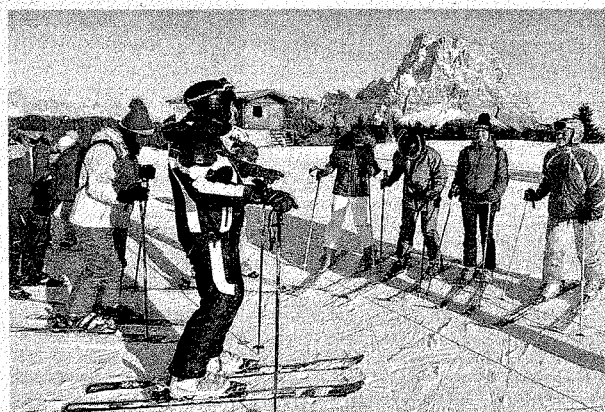
Sulle piste Ancora affollate le montagne bellunesi per le vacanze di Pasqua